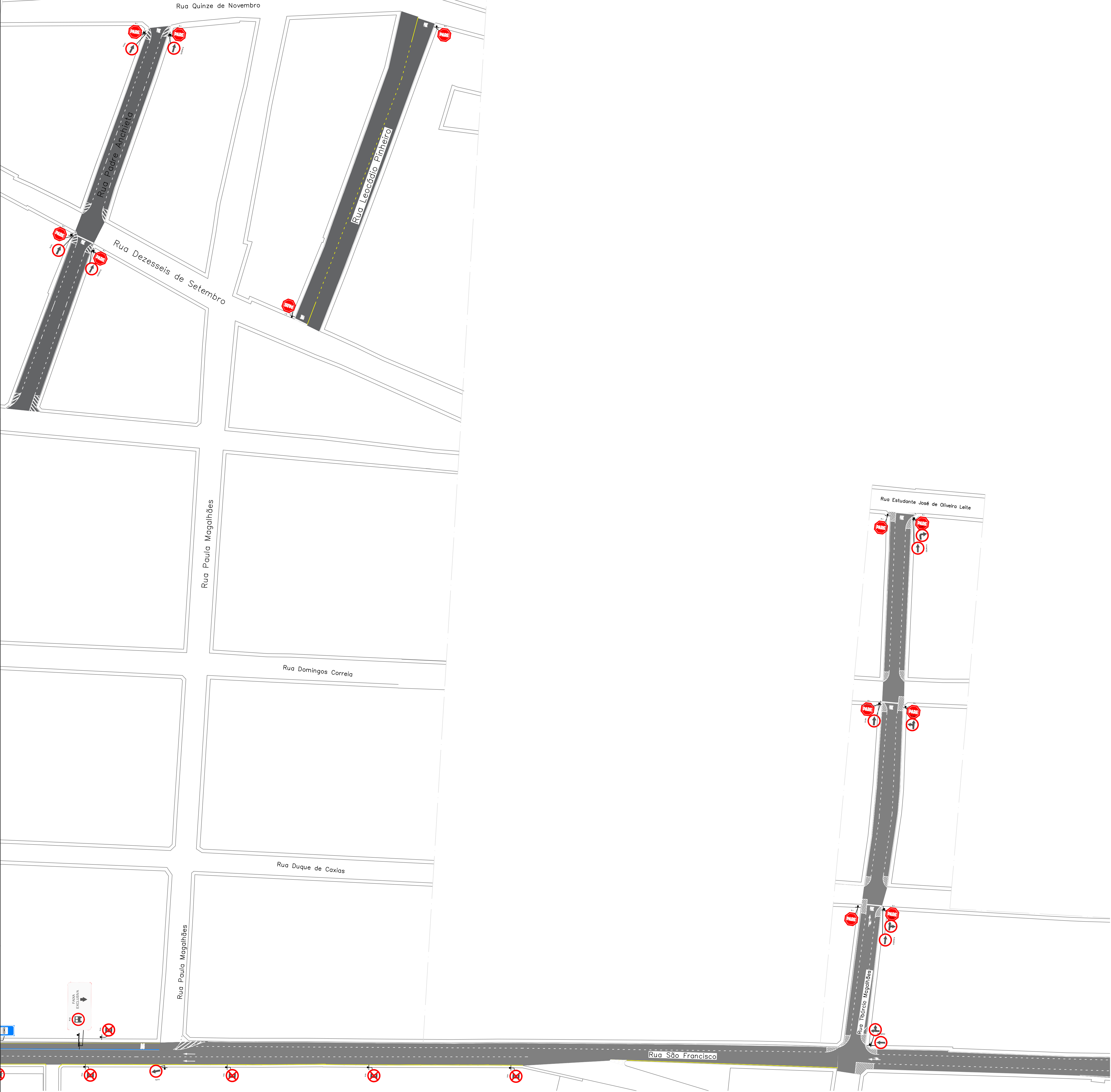
3 PLANTA BAIXA-TRECHO 03 ESCALA: 1/750